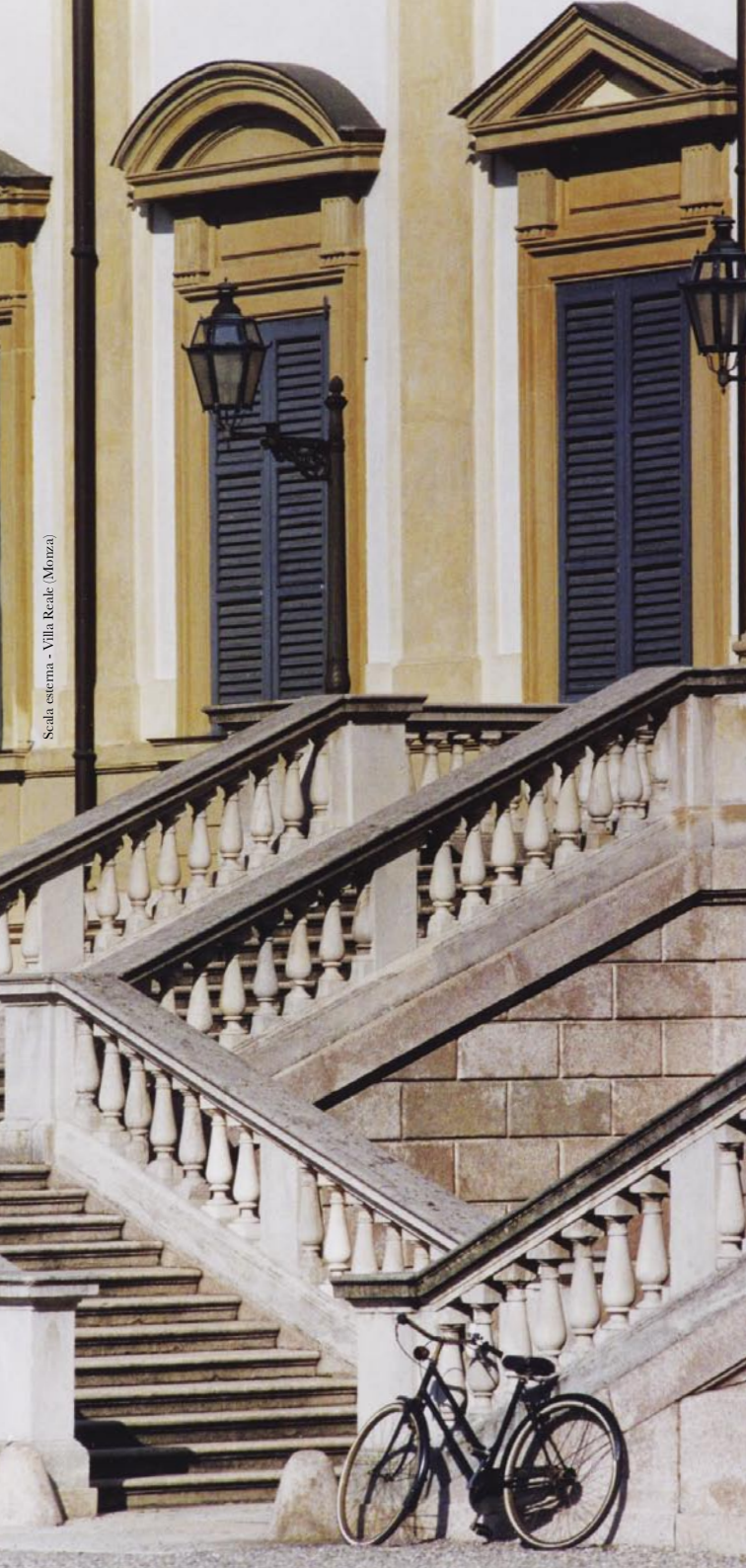
Scala esterna - Villa Reale (Monza)